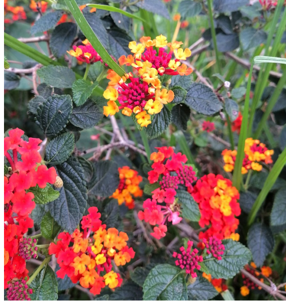
Figura 3. Lantana camara .

hecho que comprobamos encontrando valores muy elevados de SGOT, de bilirrubina y al observar las lesiones histológicas.